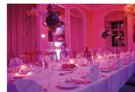
DEKO UND SONSTIGE DIENSTLEISTUNGEN / DECORATION AND OTHER SERVICES