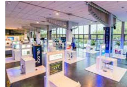
AUSSTELLERHANDLING / EXHIBITOR MANAGEMENT