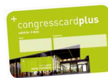
CONGRESSCARDPLUS / CONGRESSCARDPLUS