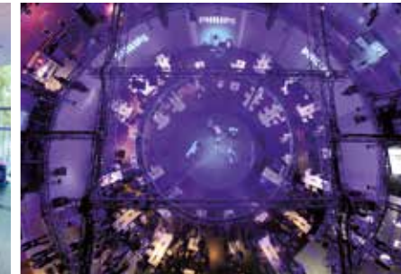
TECHNIK / EQUIPMENT