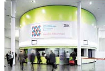
TEILNEHMERHANDLING / ATTENDEE MANAGEMENT