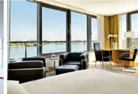
HOTELZIMMER / HOTEL ROOMS