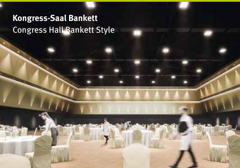
Kongress-Saal Bankett Congress Hall Bankett Style