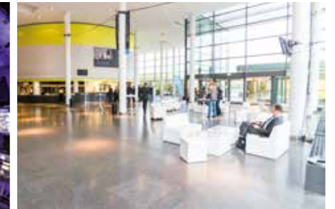
TAGUNGSBÜRO / CONFERENCE OFFICE