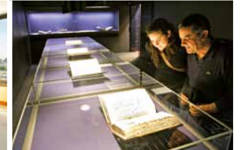
RAHMENPROGRAMM / SIDE PROGRAMME