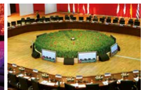
GRÜN TAGEN / GREEN MEETINGS