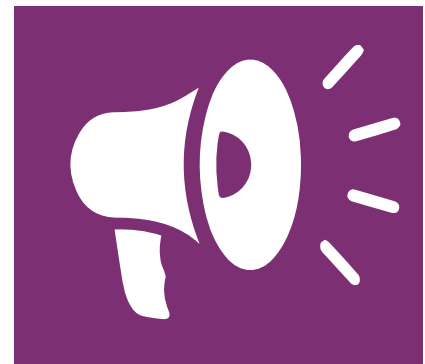
Marketing & Vertrieb