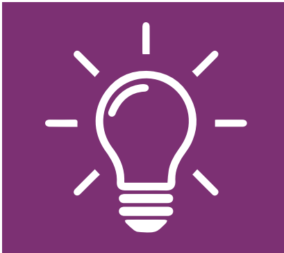
Konzeption & Beratung

Wir unterstützen Sie bei der Konzeption, Planung, Produktion, Umsetzung, Ausstrahlung und Vermarktung Ihrer digitalen Events. Mit unserer Marke mainzplus DIGITAL garantieren wir Ihnen den gewohnten „Full Service“ der mainz plus CITYMARKETING GmbH.