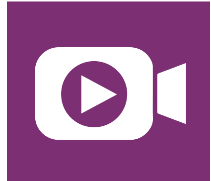
Produktion & Streaming